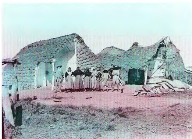
Foto 1. Barraques de pagesos. Principis del segle xx