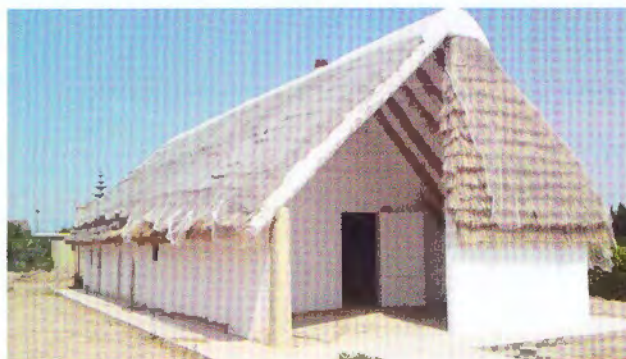
Foto 2. Barraca de nova construcció seguint el model tradicional. Centre d'interpretació de les barraques del Delta, a Sant Jaume d'Enveja

La seva preocupació i interès els va portar a aprendre l'antic ofici dels barraquers i a iniciar el procés de recuperació i reconstrucció. Des de llavors, per encàrrec de les administracions o de particulars, se'n poder comptabilitzar al voltant de seixanta (vegeu mapa de catalogació a l'annex). No obstant això, avui les barraques tenen una altra funcionalitat, més d'acord amb l'ús contemporani que la societat ha assignat a la major part d'edificacions rurals tradicionals. Així, hi trobem barraques reconvertides en cases rurals, restaurants, centres d'informació i interpretació, museus, sales d'exposicions i segones residències.